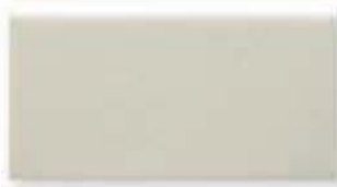
ADOC1002 - ADM16 LISO WHITECAPS 7,5 x 15 cm.