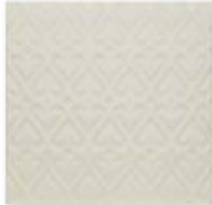
ADOC4006 - ADP33 RELIEVE PERSIAN WHITECAPS 15 x 15 cm.