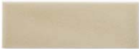
ADOC1007 - ADM18 LISO SAND DOLLAR 7,5 x 22,5 cm.