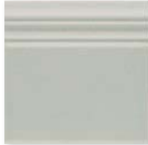
ADOC5066 - ADP38 RODAPIE SURF GRAY 15 x 15 cm.