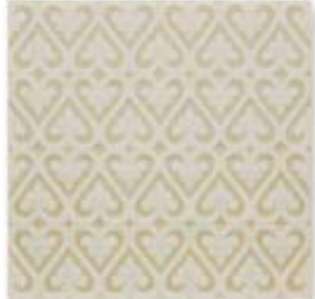
ADOC4007 - ADP33 RELIEVE PERSIAN SAND DOLLAR 15 x 15 cm.