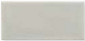
ADOC1004 - ADM16 LISO SURF GRAY 7,5 x 15 cm.