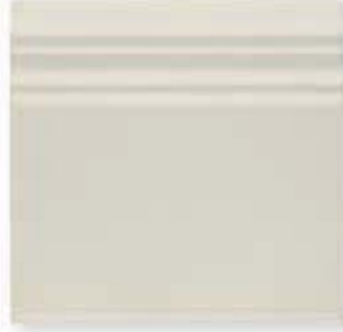
ADOC5064 - ADP38 RODAPIE WHITECAPS 15 x 15 cm.