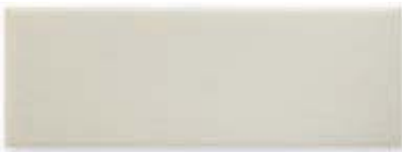
ADOC1006 - ADM18 LISO WHITECAPS 7,5 x 22,5 cm.