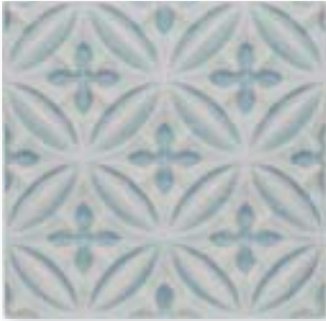
ADOC4001 - ADP33 RELIEVE CASPIAN TOP SAIL 15 x 15 cm.