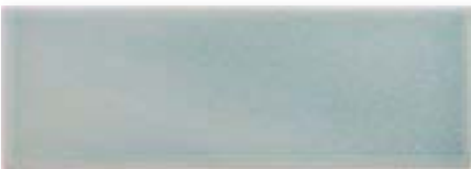
ADOC1005 - ADM18 LISO TOP SAIL 7,5 x 22,5 cm.