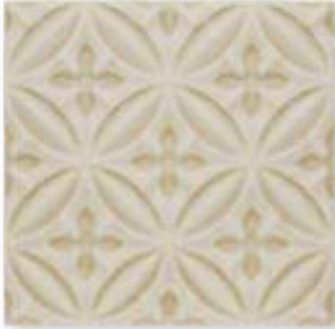
ADOC4003 - ADP33 RELIEVE CASPIAN SAND DOLLAR 15 x 15 cm.