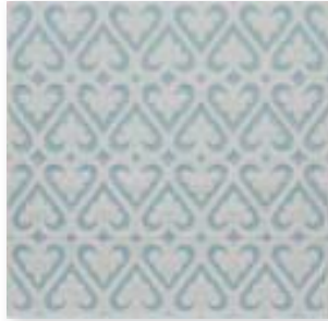
ADOC4005 - ADP33 RELIEVE PERSIAN TOP SAIL 15 x 15 cm.