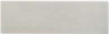
ADOC1008 - ADM18 LISO SURF GRAY 7,5 x 22,5 cm.