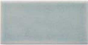
ADOC1001 - ADM16 LISO TOP SAIL 7,5 x 15 cm.