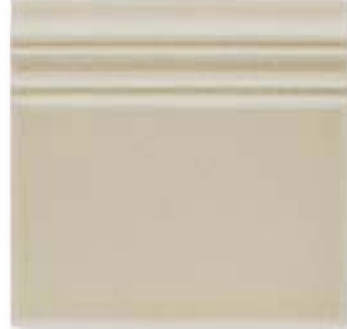
ADOC5065 - ADP38 RODAPIE SAND DOLLAR 15 x 15 cm.