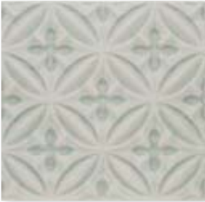
ADOC4004 - ADP33 RELIEVE CASPIAN SURF GRAY 15 x 15 cm.