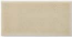
ADOC1003 - ADM16 LISO SAND DOLLAR 7,5 x 15 cm.