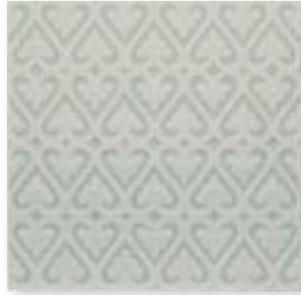
ADOC4008 - ADP33 RELIEVE PERSIAN SURF GRAY 15 x 15 cm.