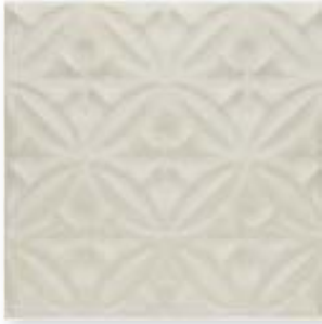
ADOC4002 - ADP33 RELIEVE CASPIAN WHITECAPS 15 x 15 cm.