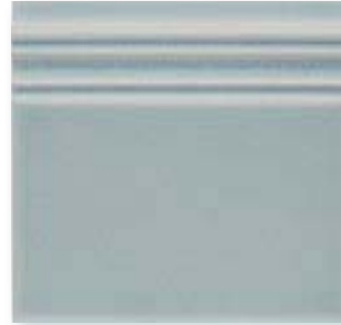
ADOC5063 - ADP38 RODAPIE TOP SAIL 15 x 15 cm.